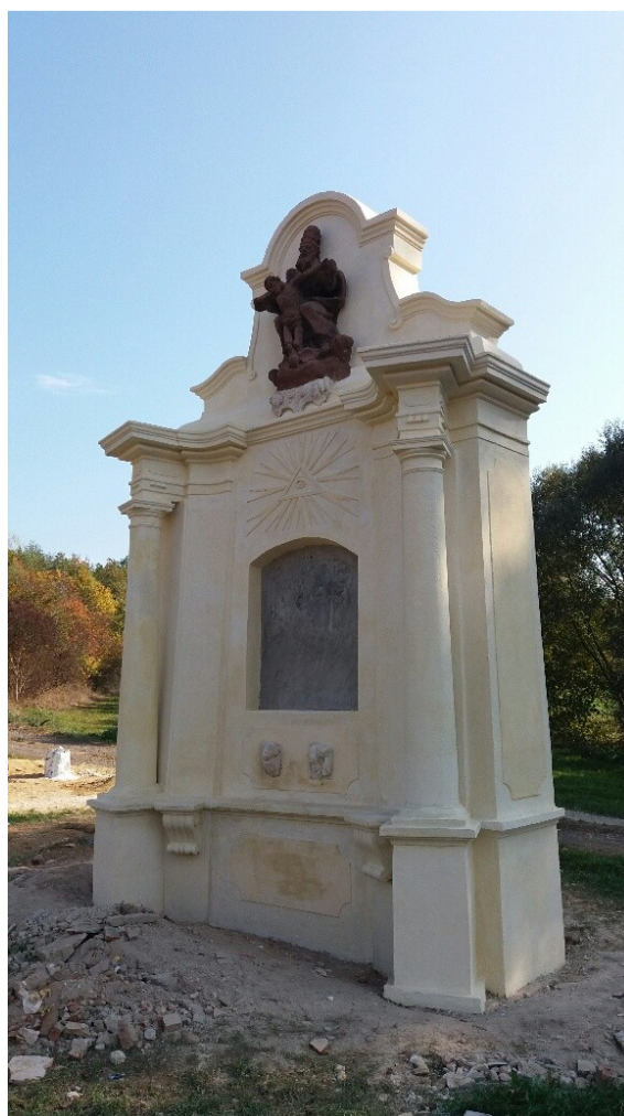
Kaple po opravě – foto říjen 2018