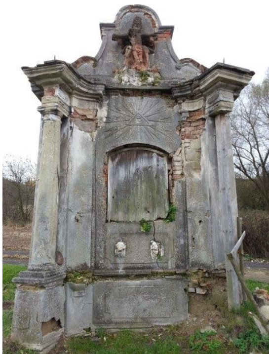
Kaple před opravou – foto z roku 2013

Obnovené Výklenkové kapli Bílenec bude slavnostně požehnáno knězem katolické církve dne 30.11.2018 v 17,00 hod.. Poté společně vstoupíme do adventu zpěvem vánočních koled. Občerstvení bude zajištěno.